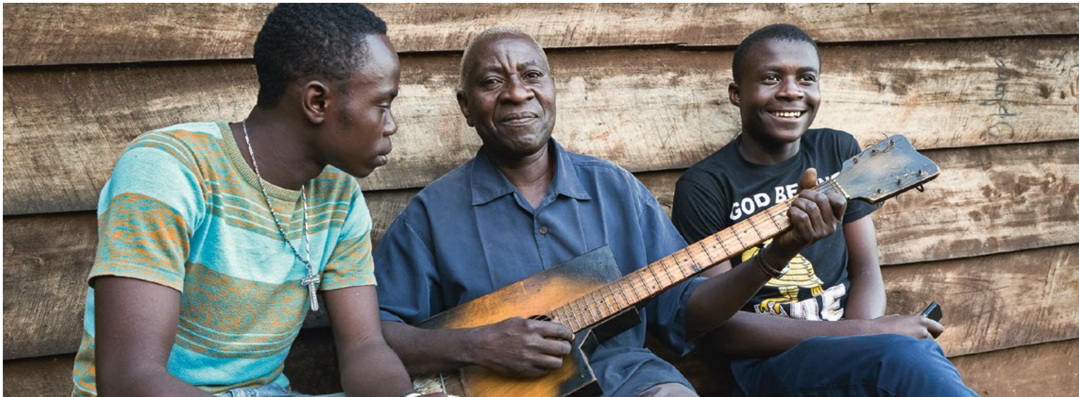
Musik in der Dämmerung: Die Gitarre wurde im Ausbildungszentrums CAPA in der Demokratischen Republik Kongo hergestellt.