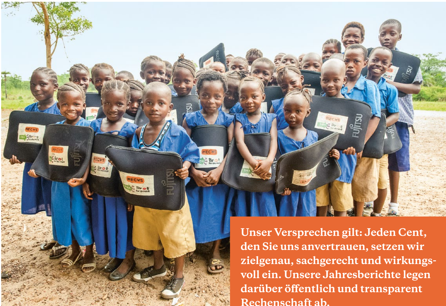
Schüler*innen der Grundschule Mafunday in Sierra Leone freuen sich auf ihren Unterricht.

Unser Versprechen gilt: Jeden Cent, den Sie uns anvertrauen, setzen wir zielgenau, sachgerecht und wirkungsvoll ein. Unsere Jahresberichte legen darüber öffentlich und transparent Rechenschaft ab.