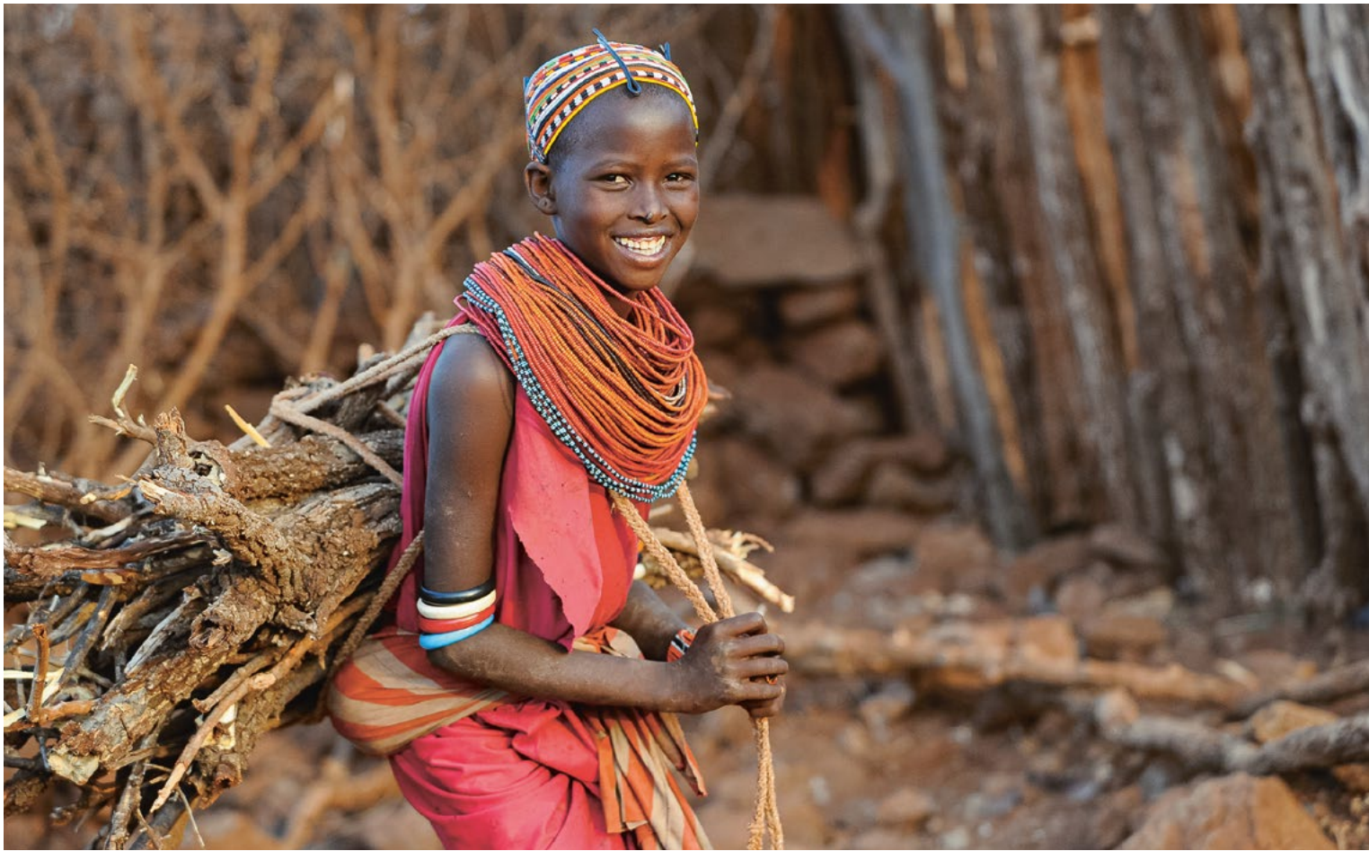
Mädchen in Kenia tragen Brennholz oft kilometerweit zu ihren Dörfern.