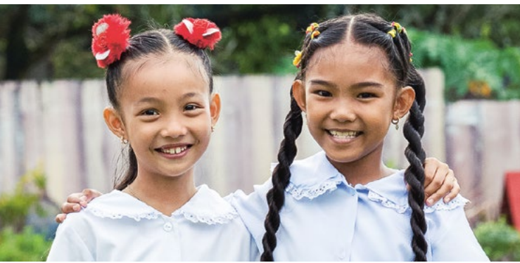
Zwei Schülerinnen der Don Arturo Alba Sr. Elementary School auf den Philippinen.