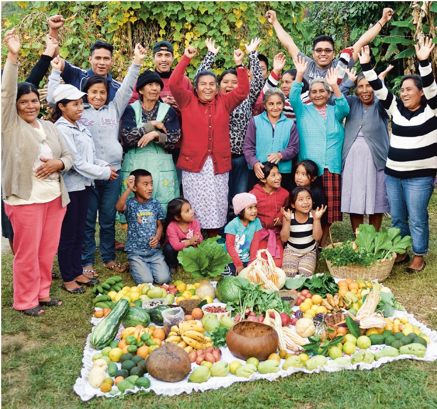
Kleine Hausgärten bringen reiche Ernte in San Marcos Moctum, Mexiko.