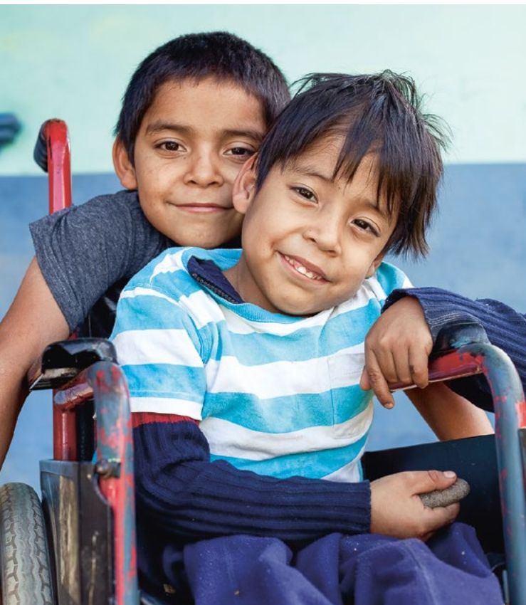
Zwei Kinder bei einem Treffen einer Frauengruppe in Tegucigalpa, Honduras.