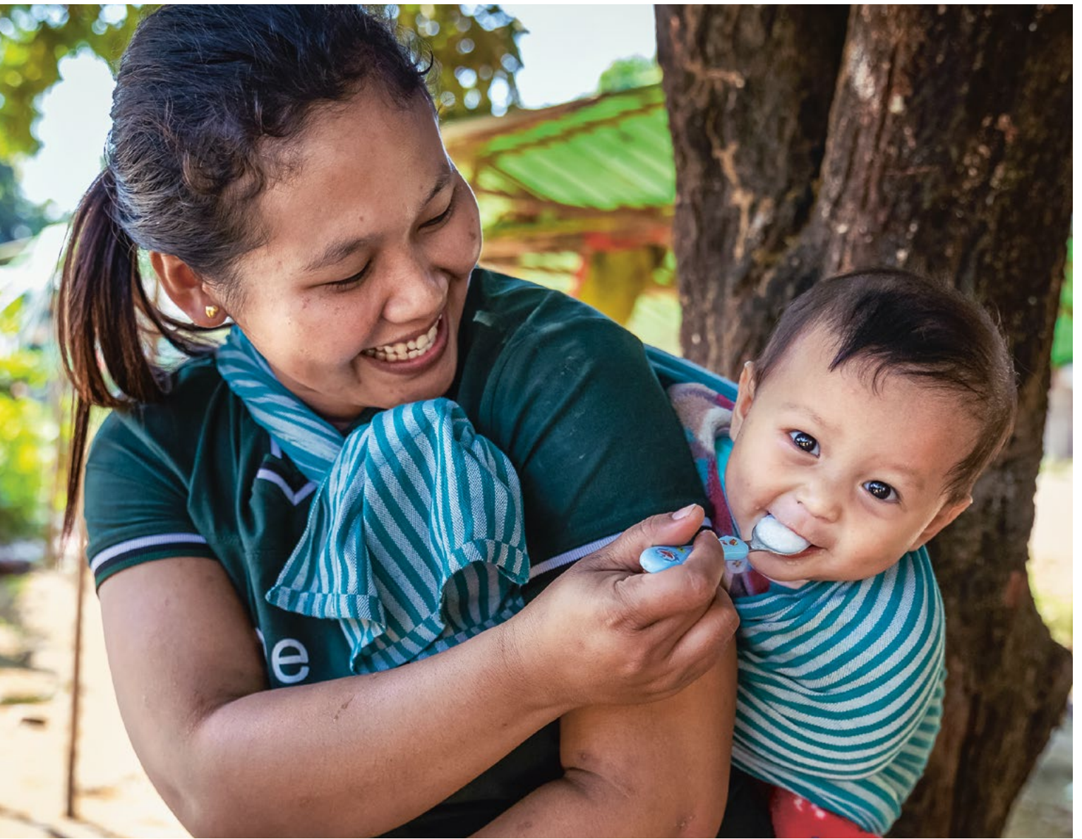
Eine junge Mutter im Tat Kone IDP Flüchtlingscamp in Myikyina, Myanmar.

Besonders freut es uns, wenn Sie uns Ihr Erbe oder Ihr Vermächtnis ohne Zweckbindung hinterlassen. Bitte geben Sie kein bestimmtes Projekt oder Land an, für das Ihre testamentarische Zuwendung eingesetzt werden muss. So ermöglichen Sie uns, rasch dort zu helfen, wo die Hilfe am dringendsten gebraucht wird. Falls Ihnen ein bestimmter Zweck jedoch besonders am Herzen liegt, nehmen Sie bitte mit uns Kontakt auf, bevor Sie Ihr Testament aufsetzen.