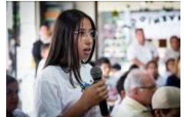
Kinder an die Macht Callescuola gibt den Kindern eine Stimme. Bei der Versammlung mit dem Bürgermeister im Zentrum von Callescuola treten sie für ihre Rechte ein.

Brot für die Welt gilt durch seine Arbeit mit den indigenen Gemeinden in Paraguay als großer Verteidiger der Menschenrechte. Wir hätten aber niemals eine Zusammenarbeit für möglich gehalten, weil wir bisher keine direkten Projekte mit indigenen Gemeinden hatten. Über den Kinderschutz haben wir jetzt diese Lücke geschlossen und viel von Brot für die Welt gelernt. Wir haben eine Studie über die aktuelle Lebenssituation von indigenen Kindern und Jugendlichen erstellt, die diese jetzt selbst als Argumentationshilfe gegenüber den Behörden verwenden. Das ist großartig. Auch der ganzheitliche Blick von Brot für die Welt auf Kinderrechte und die Angebote zur eigenen Organisationsentwicklung gefallen uns sehr. Wir bekommen viele Anregungen, die uns weiterbringen, das motiviert uns sehr.