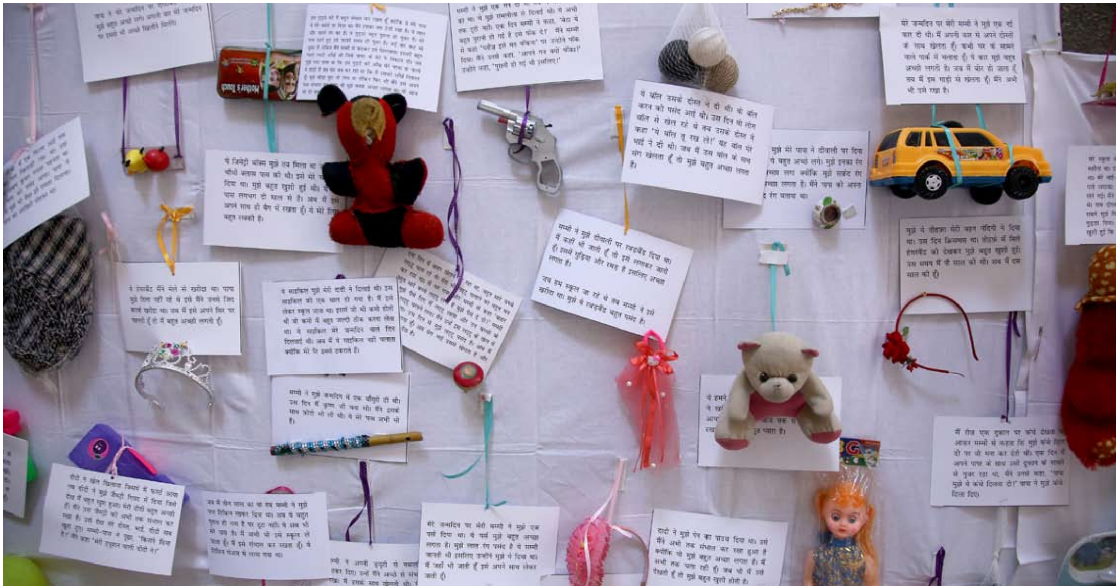
Kürzlich hat die Organisation eine Ausstellung eröffnet: Sie zeigt Lieblingsobjekte von Jungen und Mädchen aus dem Slum, die von zahlreichen kleinen Geschichten flankiert sind.