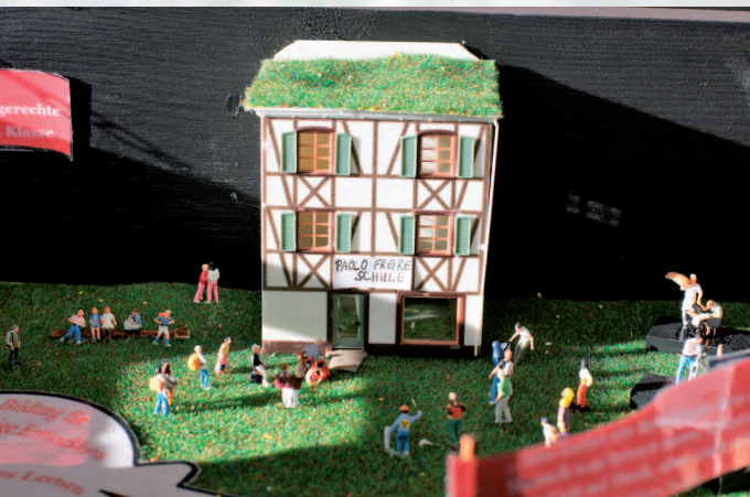
Ziel 4: Hochwertige Bildung