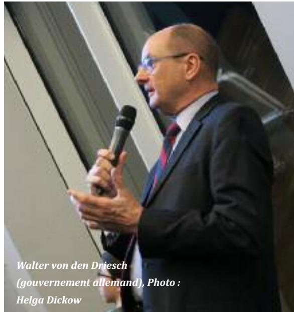
Walter von den Driesch (gouvernement allemand)

sur le marché aux bestiaux de Boulkessy dans le Centre du Mali le 19 mai 2018 en représailles suite à une attaque menée contre une patrouille de l'armée malienne.