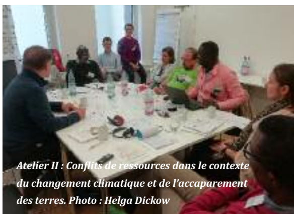
Atelier II : Conflits de ressources dans le contexte du changement climatique et de l'accaparement des terres.