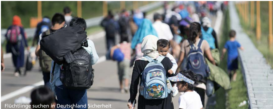
Flüchtlinge suchen in Deutschland Sicherheit

planen und Konflikten vorzubeugen. So reagierten viele Kommunen erst, wenn Konflikte etwa in fremdenfeindliche Ausschreitungen eskalieren. Anstatt die Vorbehalte der Bevölkerung gegenüber