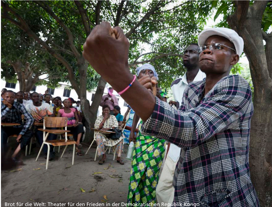
Brot für die Welt: Theater für den Frieden in der Demokratischen Republik Kongo

litische Expertise; sie sind zum Beispiel weder mit kommunalen Strukturen noch mit landespolitischen Vorgaben vertraut. Wenn die Organisationen der internationalen Friedensarbeit ihre international erworbene Expertise in nationale Prozesse einbringen wollen, müssen sie sich zunächst sachkundig und damit Gesprächsfähig machen.