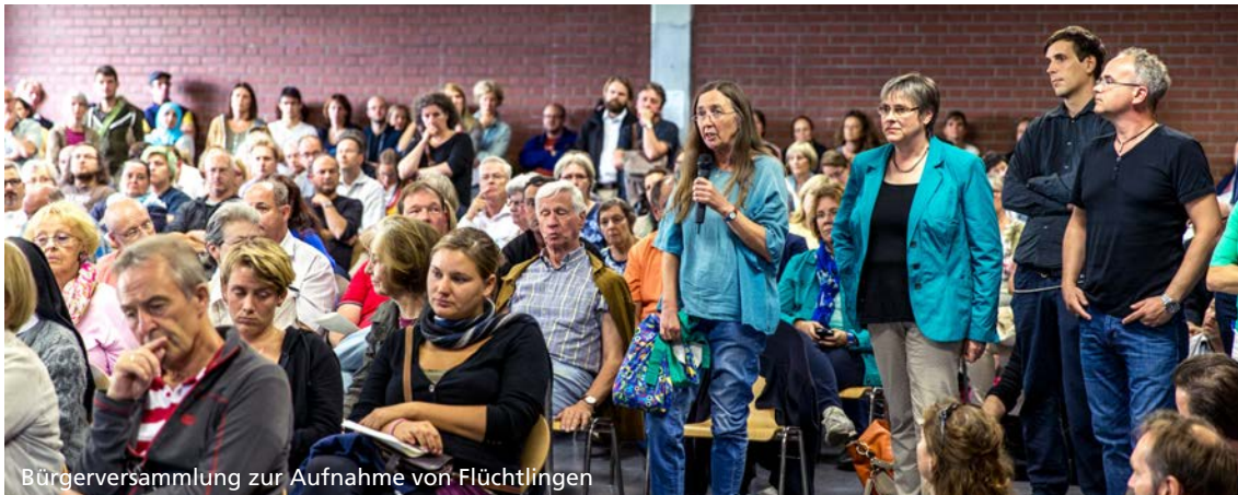
Bürgerversammlung zur Aufnahme von Flüchtlingen