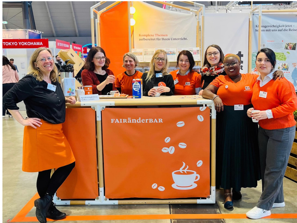
Am Brot für die Welt Stand bei der didacta 2025

Eingeladen sind am Thema Bildung interessierte Stipendiat*innen, um als kleine STIPE-Delegation die Messe zu besuchen. Geplant ist, dass wir die Messepräsenz von Brot für die Welt verstärken und am eigenen Stand Bildungsmaterialien vorstellen. Parallel werden wir an Workshops und Diskussionen teilnehmen. Vor Ort ist außerdem eine Vernetzung mit verschiedenen Bildungsakteuren und NGOs möglich.