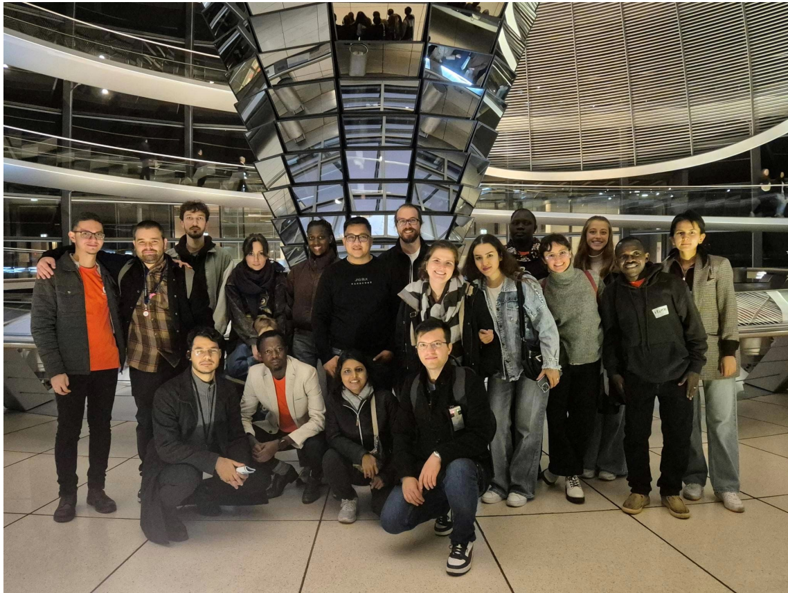
Neue Stipendiat*innen beim Einführungsseminar 2025 im deutschen Bundestag

Das verpflichtende Seminar richtet sich an die neuen Stipendiat*innen in allen Stipendienprogrammen. Es bietet Orientierung in Bezug auf die Programme, den Verlauf der Förderung und das Stipendienbegleitprogramm STIPE. Die Teilnehmenden haben die Möglichkeit, Brot für die Welt kennen zu lernen und die betreuenden Mitarbeitenden persönlich zu treffen. Außerdem steht ihnen das Exekutivteam beratend zur Seite. Da ein Tagesausflug in die Lutherstadt Wittenberg geplant ist, bietet sich hier die Möglichkeit, auf den Spuren Martin Luthers und an einigen Originalschauplätzen der Reformation Geschichte zu atmen.