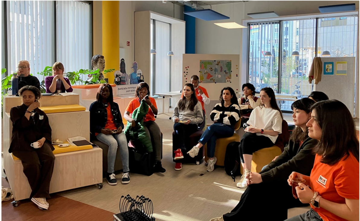
STIPE Gruppe beim Einführungsseminar im März 2025

In dem folgenden Programm führen wir alle Veranstaltungen so auf, wie wir sie Ende 2025 absehbar planen konnten. Einige, besonders externe Veranstaltungen, kommen dann noch spontan hinzu, vor allem wenn sie online stattfinden. Die aktuellen Informationen stellen wir auf EASY bzw. schicken wir euch mindestens 4 Wochen vor einem Termin eine Einladung per E-Mail.