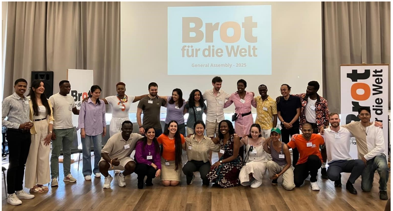
In der Hocke altes Exekutivteam (2024-25) und stehend neues Exekutivteam (2025-26)