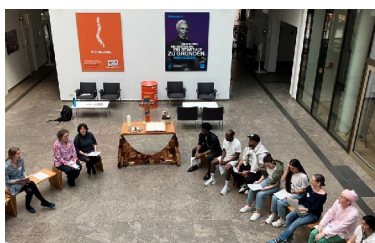
Abschiedszeremonie beim Evaluations- u. (Re-)Integrationsseminar

Das Seminar ist verpflichtend für Stipendiat*innen aller Programme, deren Förderung 2026 endet. Im Mittelpunkt steht die Reflektion des Studienaufenthaltes bzw. der Stipendienzeit, die berufliche Perspektive und die Vorbereitung darauf. Informationen zu Unterstützungsmöglichkeiten werden vorgestellt. Einige Alumni werden teilen, wie ihre Wege nach dem Stipendium verliefen und ihre persönlichen Tipps weitergeben. Wir bieten zudem ein kurzes Karriere-Coaching bzw. Bewerbungstraining an. Außerdem gibt es einen Ausblick auf die Alumni-Angebote. Höhepunkt ist der Gottesdienst am Sonntagnachmittag mit der feierlichen Übergabe der Stipendienurkunden, und am Samstagabend wird noch einmal zusammen gefeiert.