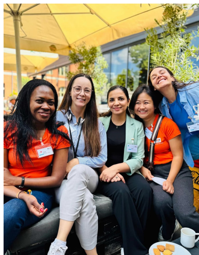
Women power im Juni 2025