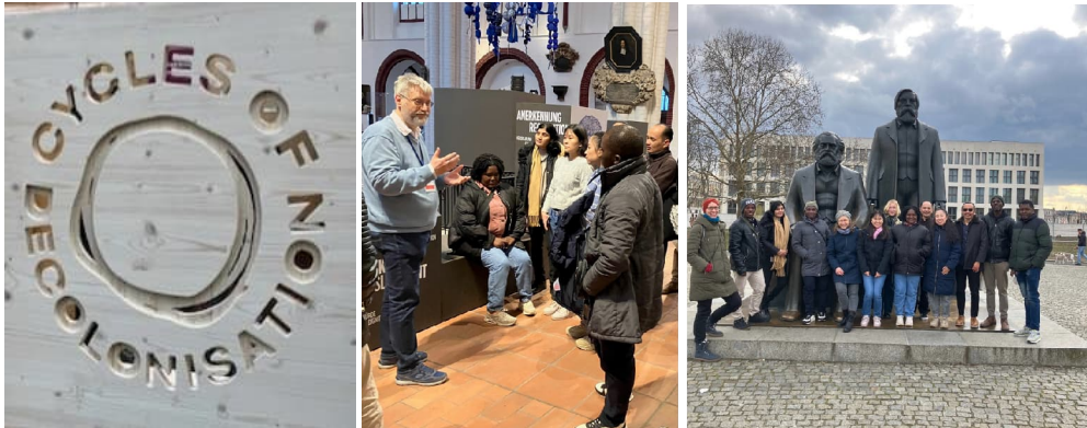
Beim Leadership-Seminar „Decoloniality“ mit Ausstellungsbesuchen in Berlin im März 2025

Verpflichtend ist das Seminar für die Leadership-Stipendiat*innen. In diesem Treffen wird sowohl ein Monitoring der Initiativarbeit als auch ein kurzes professionelles Training zu Leadership-Kompetenzen stattfinden. Als Highlight nehmen wir gemeinsam am Launch des aktuellen Atlas der Zivilgesellschaft, der von Brot für die Welt herausgegeben wird, teil.