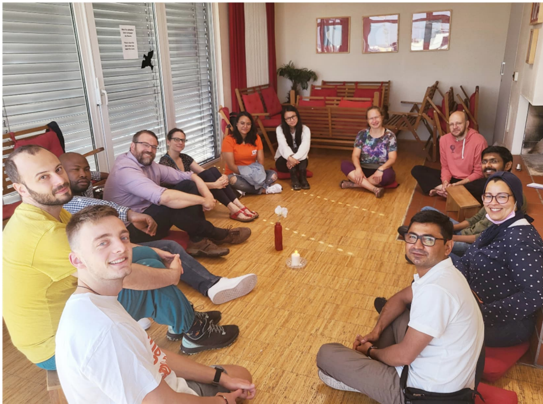
Exekutivteamtreffen in Berlin im Juli 2022