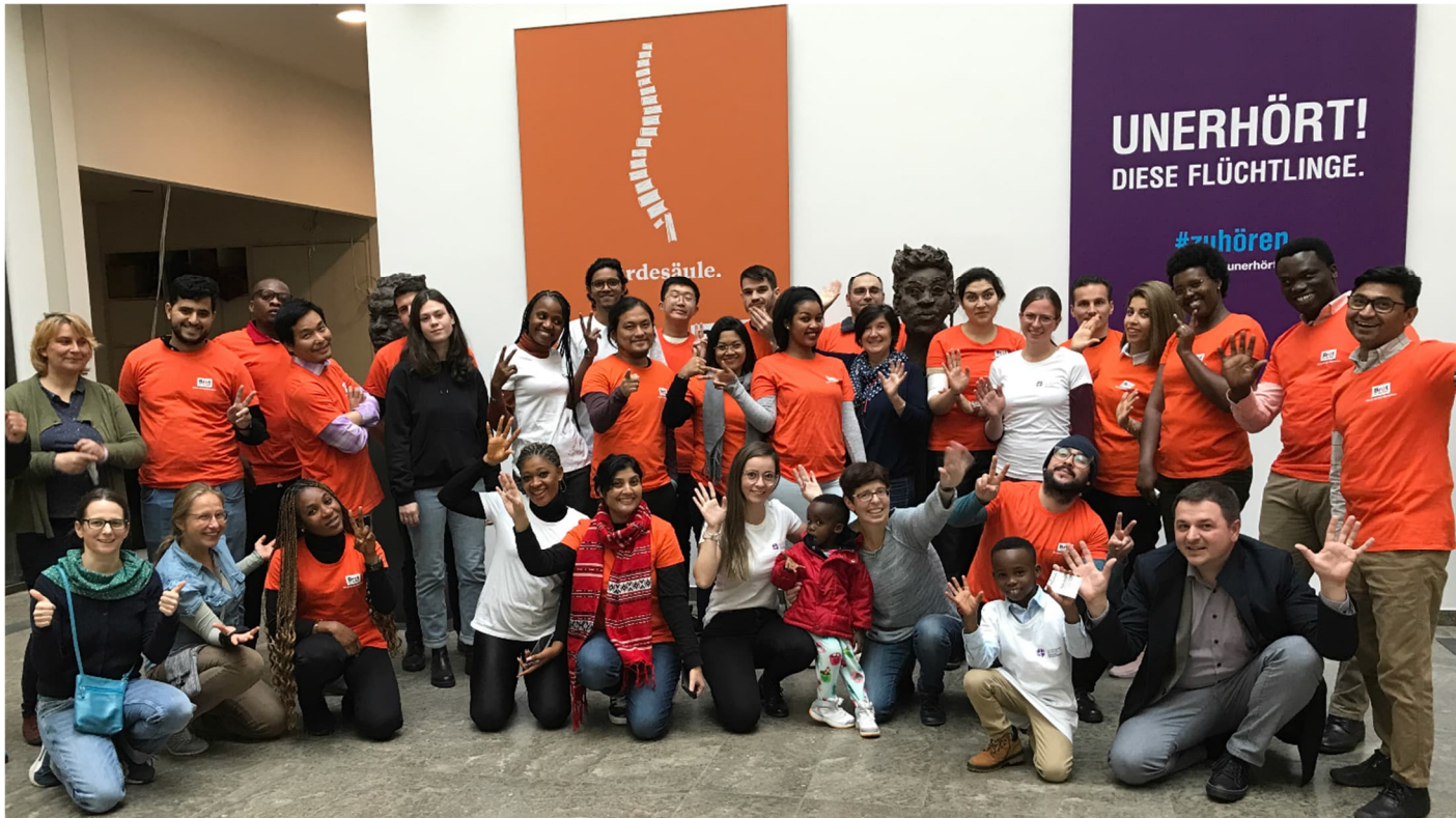
Einführungsseminar September 2022

In dem folgenden Programm führen wir alle Veranstaltungen so auf, wie wir sie Ende 2022 absehbar planen konnten: online zu Beginn des Jahres 2023 und dann in Präsenz. Es kann jedoch jederzeit zu einer Veränderung der Corona-Lage in Deutschland kommen. Wir bereiten uns darauf vor, alle Veranstaltungen online anbieten zu können. Die Termine bleiben dabei gleich! Wir werden auch mal ein blended learning-Format mit euch ausprobieren. Die Information, ob die jeweilige Veranstaltung online, hybrid oder in Präsenz stattfindet, erfahrt ihr aus der konkreten Einladung, die wir euch spätestens 4 Wochen vorher senden.