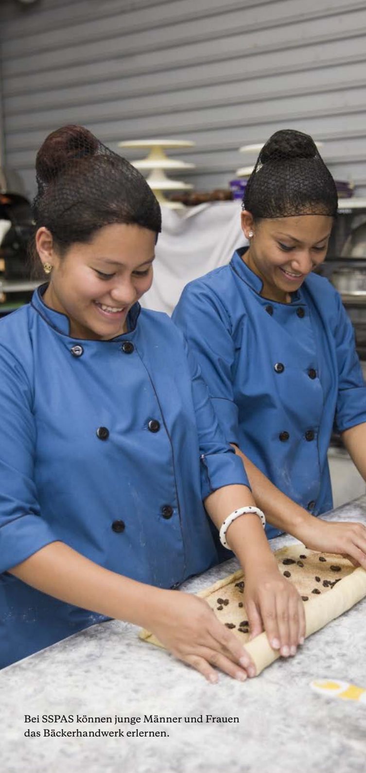
Bei SSPAS können junge Männer und Frauen das Bäckerhandwerk erlernen.

Eine Perspektive für die Chancenlosen Jugendliche aus den Favelas von San Salvador haben auf dem Arbeitsmarkt kaum eine Chance. Doch mit einer praxisnahen Ausbildung können sie es schaffen, ein selbständiges Leben zu führen.