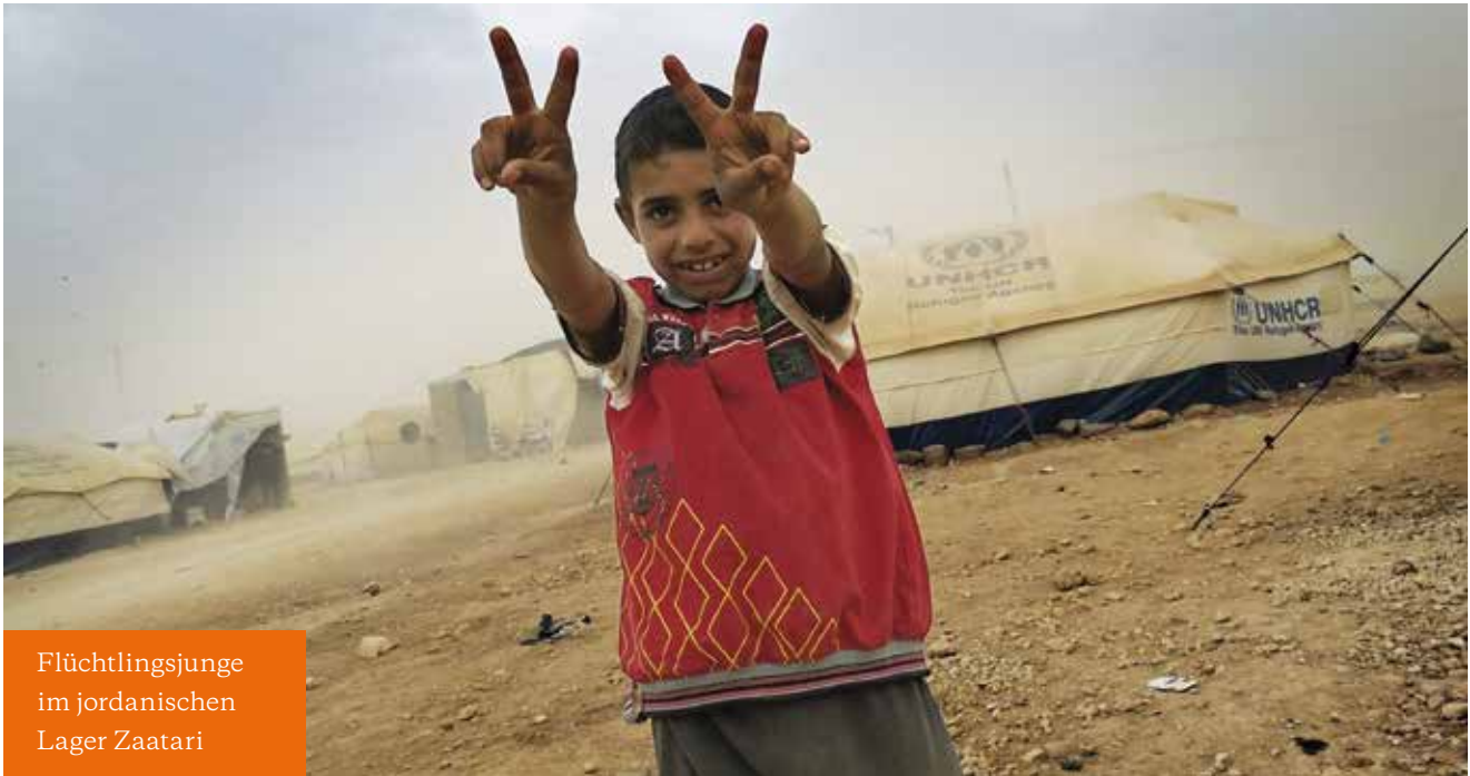
Flüchtlingsjunge im jordanischen Lager Zaatari

Die Zeitschrift Global lernen wendet sich an Lehrerinnen und Lehrer der Sekundarstufen. Sie erscheint drei mal pro Jahr und kann kostenlos bezogen werden.