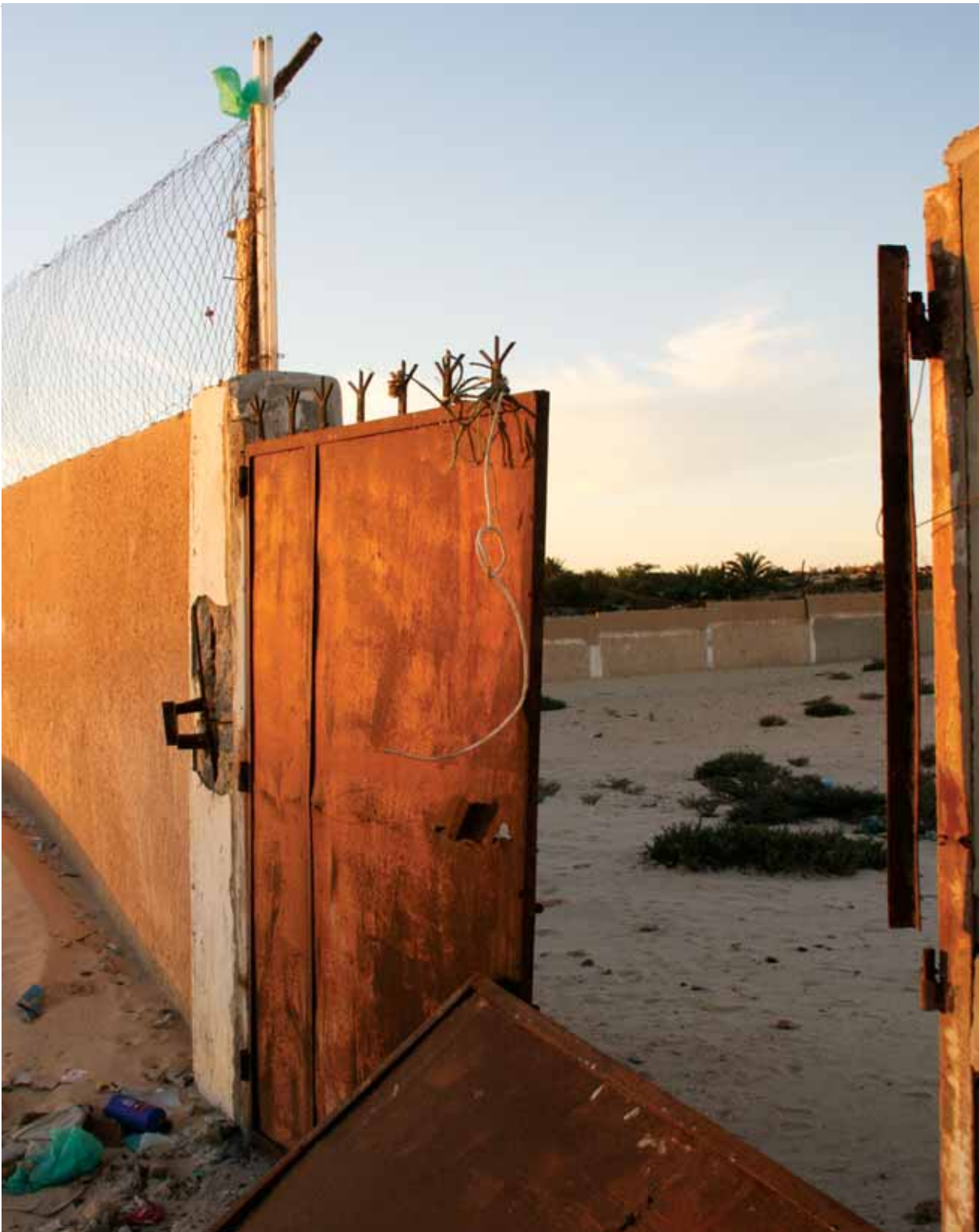
↑ DAS INTERNIERUNGSLAGER „GUANTANAMITO“ IN NOUADHIBOU, EIN HEUTE VERWAISTER ORT DER ABSCHIEBUNG

nicht irregulär ist, weil sie kaum Regeln unterworfen ist. Ihre Freizügigkeit ist auch deshalb ein Anliegen von ECOWAS, weil Mobilität auch ein wirtschaftlicher Motor für alle westafrikanischen Staaten ist. Nicht