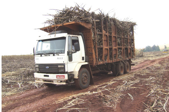
Zuckerrohrrente in Brasilien

Angesichts steigender Mineralölpreise, sinkender Ölreserven und eines unaufhaltsamen Klimawandels ist das Interesse an Kraftstoffen aus Mais, Zucker, Weizen, Raps, Soja und Palmöl in den letzten Jahren sprunghaft angestiegen. Neben einer Verminderung der Abhängigkeit von erdölexportierenden Ländern, hoffen die Regierungen auch auf neue Einnahmequellen der Landwirte durch den Anbau der Energiepflanzen und deren Verarbeitung zu Ethanol und Biodiesel. Entwicklungsländer in Lateinamerika, Afrika und Südostasien wollen eine wichtige Rolle als Kraftstoff- bzw. Rohstofflieferanten einnehmen und dadurch ihre Entwicklung vortreiben.