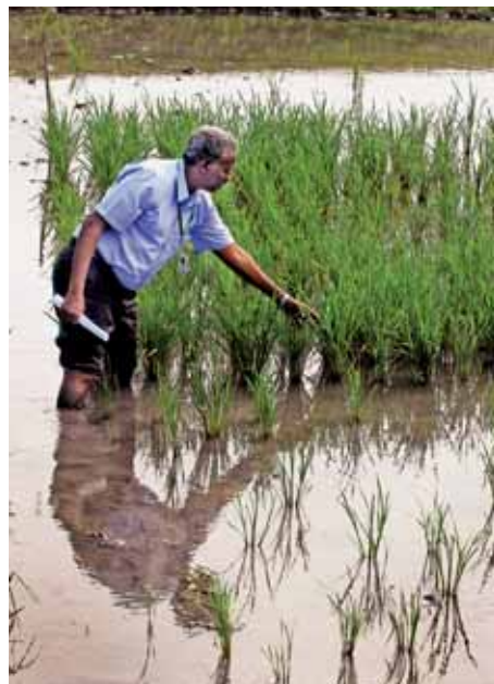
„Waterproof rice“: Dieser genveränderte Reis soll bis zu 17 Tage komplett unter Wasser überstehen.

ter sind also auf genetische Vielfalt angewiesen. Daher ist es wichtig, die genetischen Ressourcen zu erhalten, um aus diesem natürlichen Genpool zu schöpfen und Pflanzen für neue Anforderungen zu schaffen. Die genetischen Ressourcen bilden die Grundlage für das vordringlichste Ziel der Land- und Ernährungswirtschaft, auch in Zukunft unter veränderten Umweltbedingungen das Bestmögliche zur Linderung der Ernährungsprobleme