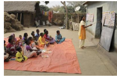
Die Bildung steht im Zentrum: Unterricht für Erwachsene im Dorf Sukna.

Zwar existiert in Indien eine Vielzahl von Programmen zur Armutsbekämpfung, zur Verringerung des Hungers und zur Verbesserung des Schulwesens. Doch nur selten kommt die Hilfe bei den Bedürftigen an. Im Zentrum der Maßnahmen des LWSI stehen deshalb Bildung und Selbstorganisation. Wer lesen und schreiben kann, versteht die Gebrauchsanweisung für Saatgut und Dünger, unterschreibt keine betrügerischen Verträge von Geldverleihern und kann ein Konto eröffnen. Vor allem aber kann er sich über seine Rechte informieren – und sie einfordern. „Als wir vor zwei Jahren in Sukna angingen, waren die meisten im Dorf Analphabeten, und kaum jemand wusste etwas von den