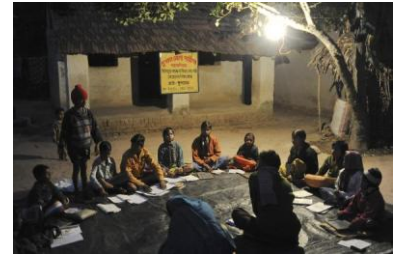
Eine von LWSI geförderte Abendschule in Kustora.

Der Lutheran World Service India (LWSI) wurde 1974 als Indienprogramm des Lutherischen Weltbundes gegründet. Mit über 200 hauptamtlichen Mitarbeitern ist das inzwischen selbständige Hilfswerk eine der großen Nichtregierungsorganisationen in Ostindien.