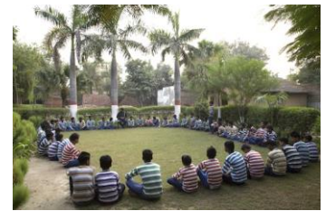
Bietet Platz für 80 Kinder Das Mukti Ashram in Delhi.

Natürlich der Friedensnobelpreis für unseren Gründer Kailash Satyarthi. Aber jede Befreiung eines einzigen Kindes ist für uns ein großer Erfolg. Abgesehen davon haben wir auf Gesetzesebene sehr viel erreicht. 2013 erließ das indische Verfassungsgericht zum Beispiel ein Urteil zugunsten vermisster Kinder, in dem es erstmalig definierte, was darunter zu verstehen ist. Daran haben wir seit 2006 gearbeitet. Überhaupt war BBA an allen entscheidenden Gesetzen zum Schutz des Kindes beteiligt.