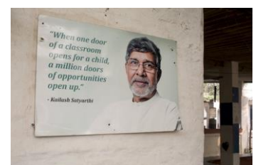
Friedensnobelpreisträger Im Mukti Ashram hängt eine Tafel mit einem Zitat von Kailash Satyarthi, dem Gründer der Bewegung zur Rettung der Kindheit.