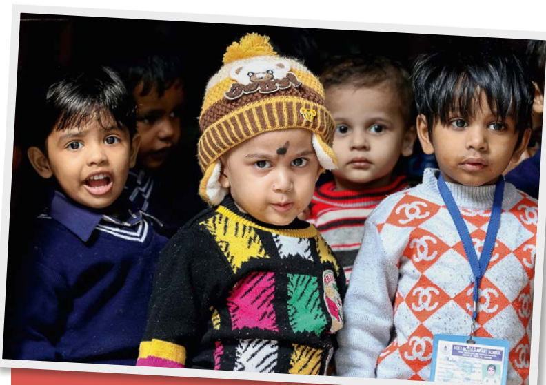
Kinder aus dem Stadtviertel Dakshinpuri in der indischen Hauptstadt New Delhi.

Unterstützt wird diese Arbeit von Brot für die Welt: ANKUR ist eine der vielen Partnerorganisationen. Für die Arbeit von ANKUR in Delhi und für zahlreiche weitere Projekte sammeln Kirchengemeinden treu Kollekte – Jahr für Jahr, seit vielen Jahrzehnten. Auch damit helfen wir, helfen Sie, die Geschichte von Gott