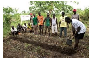
Testfeld Auf der Modellfarm von SIGA wird der effizientere Anbau von Maniok erprobt.

Zum einen das Bewusstsein, wie wichtig es ist, dass die Kinder zur Schule gehen. Aber man sieht auch ganz konkret, dass es den Menschen jetzt besser geht, weil sie neue Anbaumethoden anwenden und besseres Saatgut benutzen. So viel Reis und Maniok, wie die Bauern jetzt ernten, hatten sie früher nie. Wer sein neu erworbenes Wissen auf dem Feld nutzt, muss nicht mehr Hunger leiden. Das zeigt: Wenn alle an einem Strang ziehen, kann man die Armut überwinden.