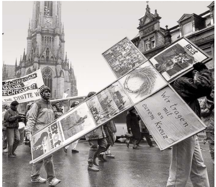
Links: Anfang der sechziger Jahre beliebt: Eigene Brot für die Welt-Spardosen aus Zigarrenröhrchen basteln. Oben: Eröffnung der 32. Aktion 1990 in Speyer.