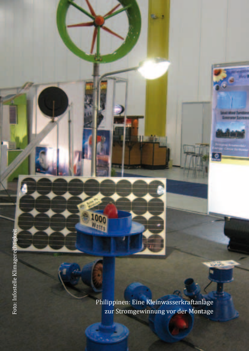
Philippinen: Eine Kleinwasserkraftanlage zur Stromgewinnung vor der Montage