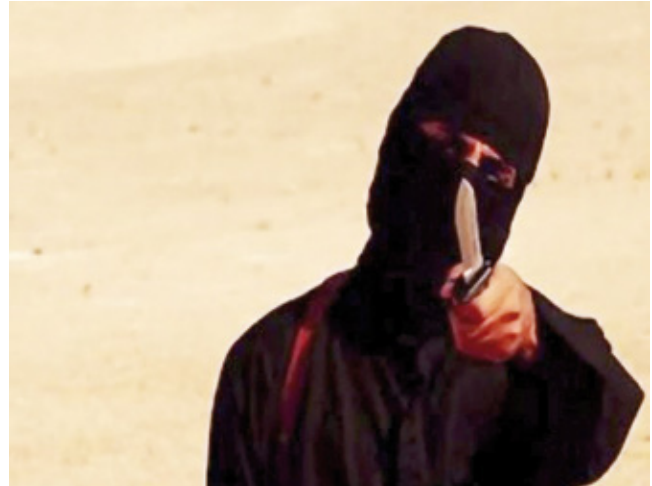
Standfoto aus einem Propagandavideo des „Islamischen Staates“.