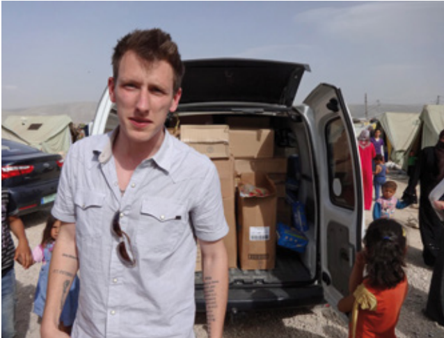
Peter Kassig wurde im Alter von 26 Jahren von Mitgliedern der Terrororganisation „Islamischer Staat“ getötet.

Schätzungen zufolge haben sich über 700 meist junge Menschen aus Deutschland auf den Weg nach Syrien gemacht, um sich der islamistischen Terrororganisation „Islamischer Staat“ anzuschließen. Dort werden sie gezwungen zu kämpfen und zu töten. Zu den Opfern gehören auch Menschen, die anderen Menschen helfen wollen – wie der Entwicklungshelfer Peter Kassig.