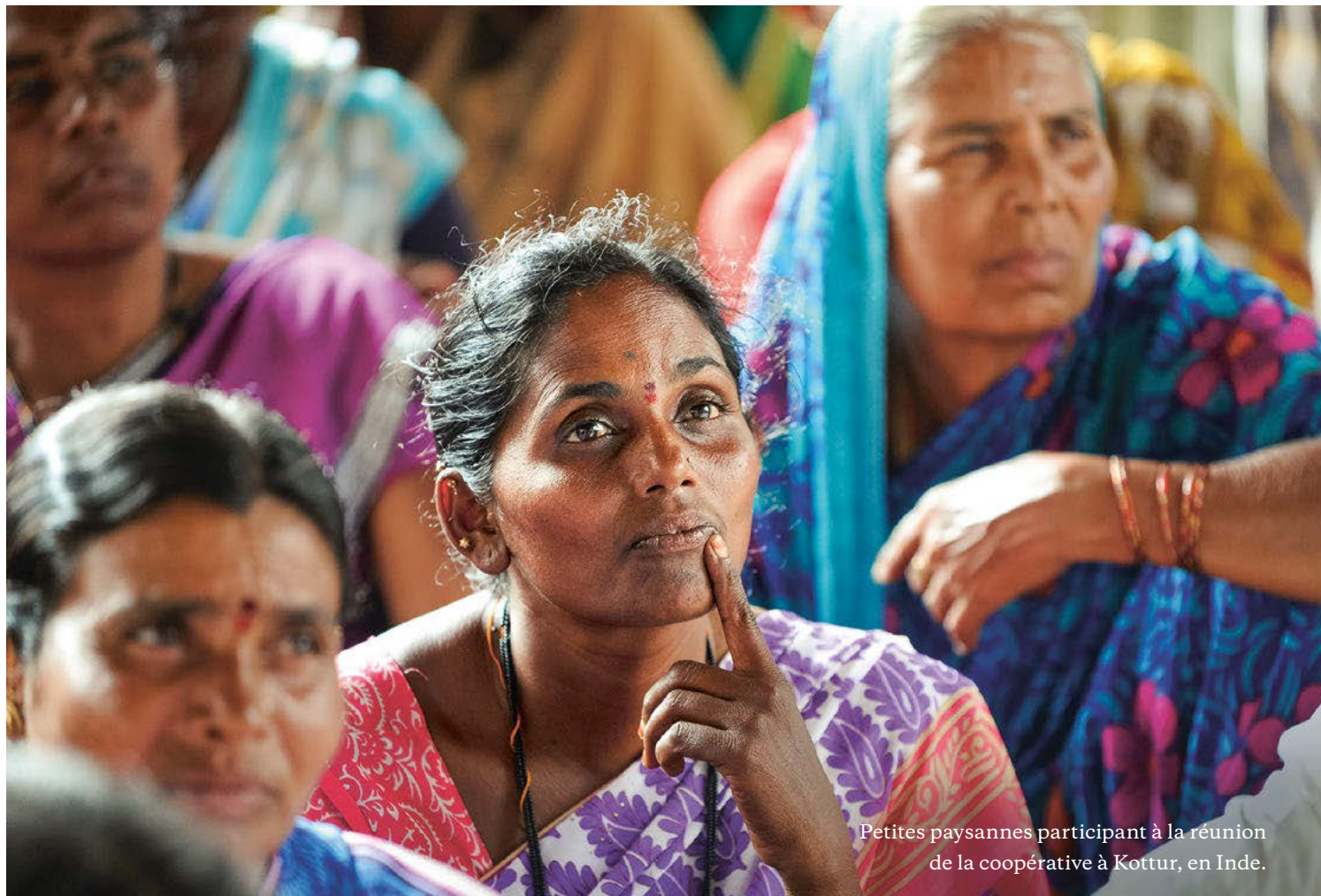
Petites paysannes participant à la réunion de la coopérative à Kottur, en Inde.