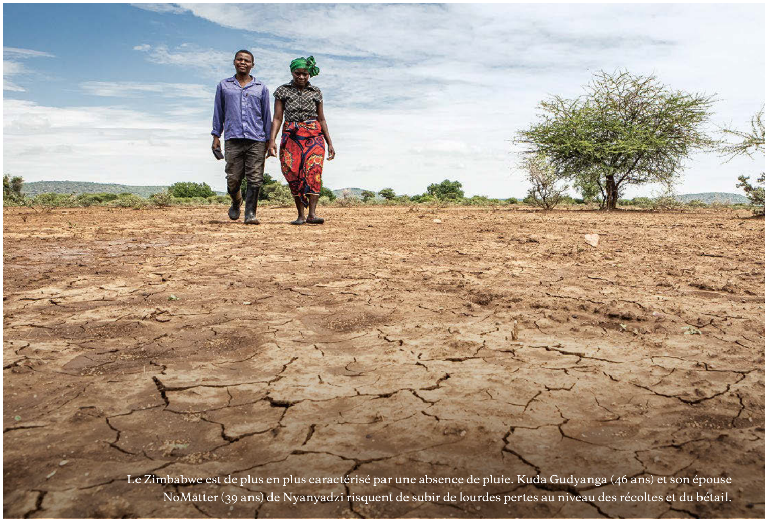
Le Zimbabwe est de plus en plus caractérisé par une absence de pluie. Kuda Gudyanga (46 ans) et son épouse NoMatter (39 ans) de Nyanyadzi risquent de subir de lourdes pertes au niveau des récoltes et du bétail.