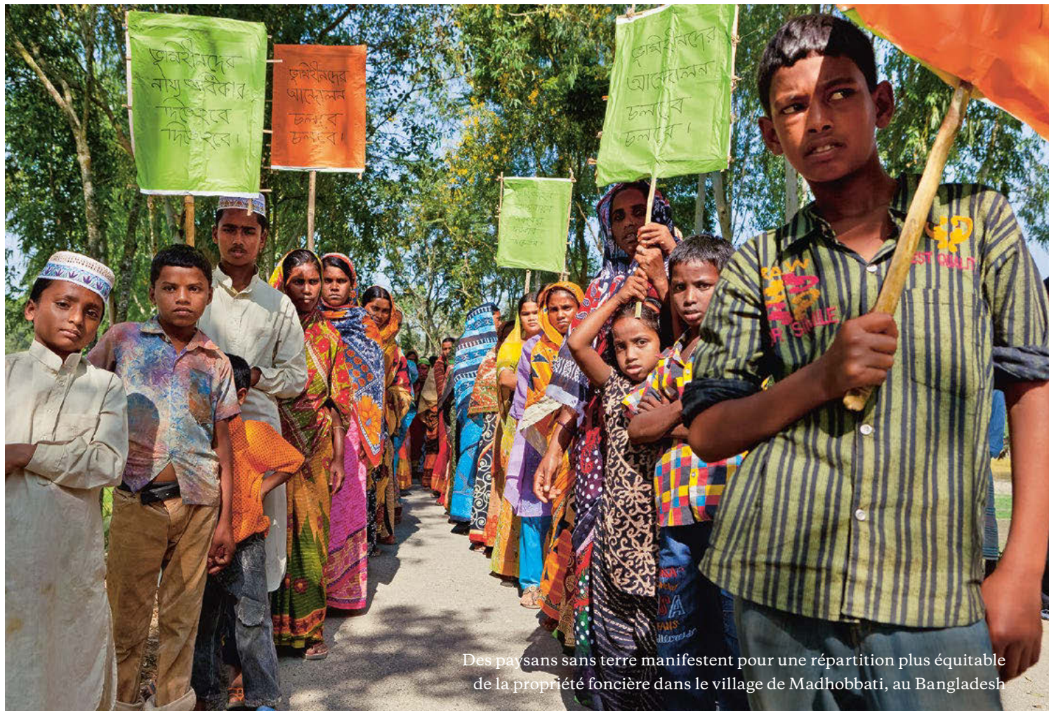
Des paysans sans terre manifestent pour une répartition plus équitable de la propriété foncière dans le village de Madhobati, au Bangladesh